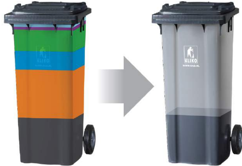
Zo is het