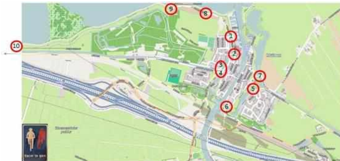
Afbeelding 2: locaties borden racefietsers te gast

De locaties liggen bij toegangen tot de vesting en langs het Jan Kerstenpad.