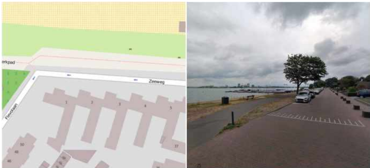
Afbeelding 8: Zeeweg

Langs de Zeeweg loopt een asfaltpad, zie afbeelding 8. Dit pad is alleen bedoeld voor voetgangers. Fietsers denken echter dat het een fietspad is en fietsen hier dan ook. Dit kan voor onveilige situaties zorgen. Met een bord wordt aangegeven dat het een voetpad. Op een onderbord komt de tekst 'Fietsers op de rijbaan' te staan.