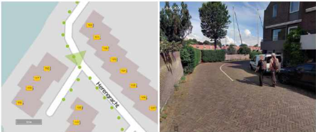
Afbeelding 4: Herengracht t.h.v. woning met huisnummer 100

In de andere bocht, t.h.v. de woning met huisnummer 100 ontbreekt een trottoir aan beide zijdes, zie afbeelding 4.