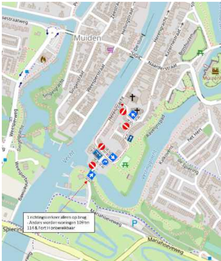
Afbeelding 5: instellen éénrichtingsverkeer

Door het trottoir rijden de fietsers in de bocht t.h.v. de woning met huisnummer 109 niet meer vlak langs de heg. Door het éénrichtingsverkeer worden de fietsers die de vesting uit rijden niet meer geconfronteerd met voertuigen die de vesting in de bocht afsnijden. Het overzicht op dit punt neemt toe omdat voertuigen niet meer door de binnenbocht vesting uit rijden. Dit laatste geldt ook voor de locatie t.h.v. de woning met huisnummer 100. Bijkomend voordeel is dat de voetgangers over een eigen plek op de weg kunnen beschikken.