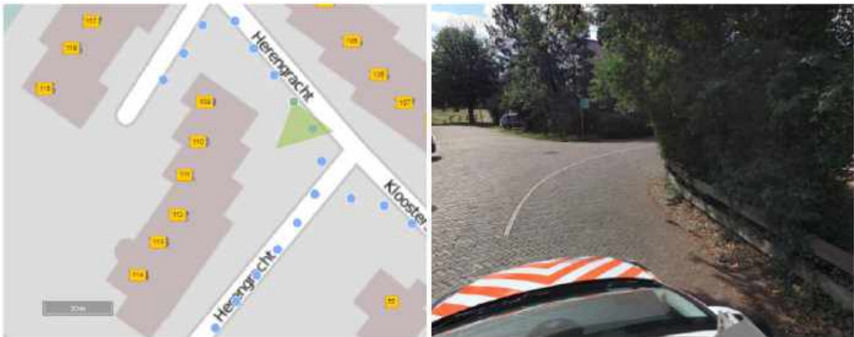
Afbeelding 3: Herengracht t.h.v. woning met huisnummer 109

In de binnenbocht t.h.v. de woning met huisnummer 109 (zie afbeelding 3) ontbreekt een trottoir. Hierdoor rijdt verkeer vlak langs de heg. Het meer naar het midden van de weg fietsen is niet veilig door tegenliggers die mogelijk de bocht afsnijden.