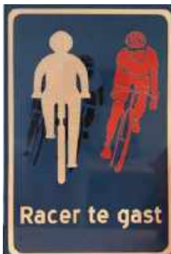
Afbeelding 1: bord racefietsers te gast

Een deel van de problematiek wordt door de snelheid en gedrag van racefietsers veroorzaakt. Om de racefietsers meer bewust te maken dat zij hun gedrag aan de omstandigheden moeten aanpassen om de situatie veilig te houden worden op een aantal locaties borden geplaatst. Het bord is op afbeelding 1 weergegeven.