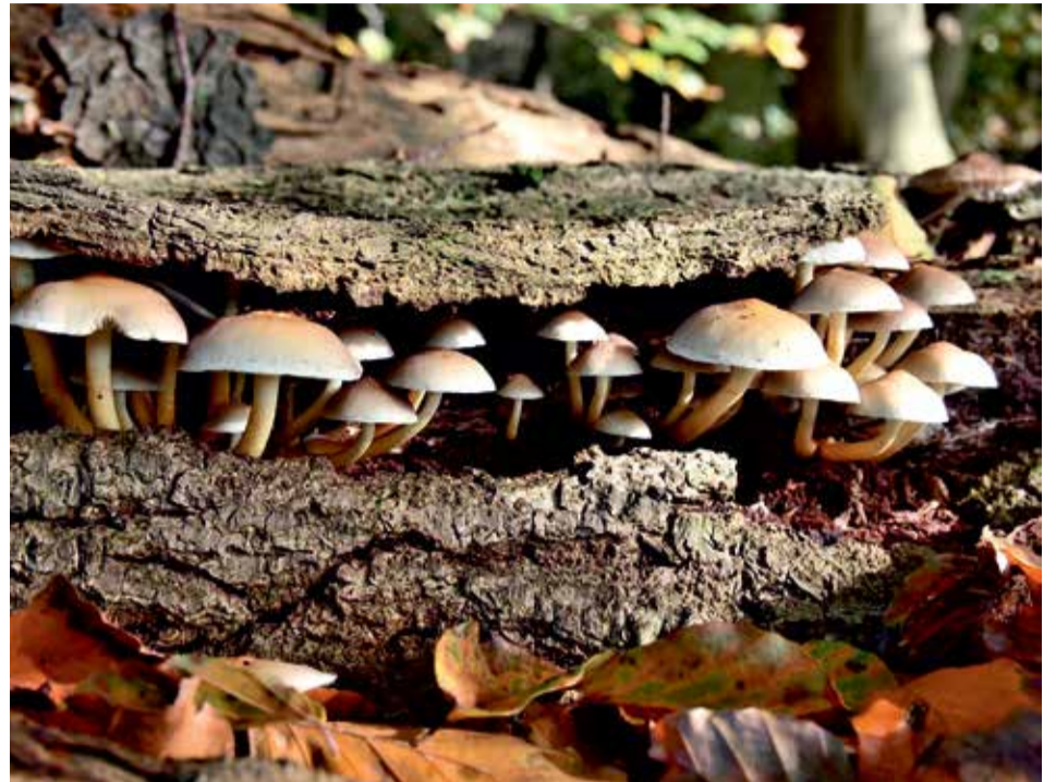
Paddestoelen in het Echobos voelen zich lekker tussen oud hout en blad

De sloten in de gemeente worden deze maand geschoond en ook daar is er veranderend bewustzijn: bermen en sloten zijn bij elkaar bijna net zo'n groot oppervlakte als natuurgebieden! Natuurlijk hebben we te maken met verkeersveiligheid en waterafvoer maar als er hier en daar een slootkant een jaar wordt overgeslagen kunnen daar heel veel dieren en zaden overleven... het jaar erop kan het dan gewoon wel geschoond worden. Het is daarentegen wel goed als het slootmaaisel afgevoerd wordt, want net als bermmaaisel