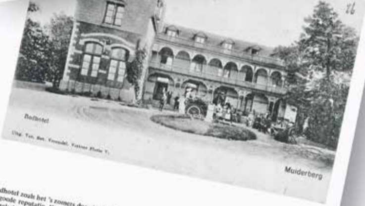
30. Hier ziet u het badhotel zoals het 's zomers door honderden gasten werd bezocht. Het groot lot was in de ontrief een goede reputatie. Het had een eigen muziek-ent, waar elke zaterdagavond muziek werd gemaakt door gezelschappen uit Amsterdam of plaatsen in het Gooi. In 1899 veranderde het van eigenaar. Het werd toen verkocht voor fl. 6100,-. Enige jaren later werd het hotel door een brand volledig verwoest.

Twee pagina's uit het boekje met Muiderbergse ansichten van Piet de Raadt