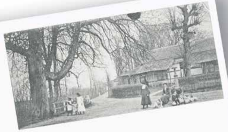
14. We bevinden ons hier bij het noordwestelijke gedeelte van de Brink. Rechts op de foto zien we café „De Echo“. De bestemming hiervan is in de loop der jaren nogal eens veranderd. Het gebouw is gebruikt als gereformeerde kerk, verenigingsgebouw, dependance van de christelijke school en Witte-Kruisgebouw. Thans doet het dienst als katholieke kapel. Links staat de ongeveer twee eeuwen oude kastanje, waarvan de rijkdom net zo dik is als de stam. Acht stangen houden de arm op zijn plaats en bebooden hem voor afschouren.