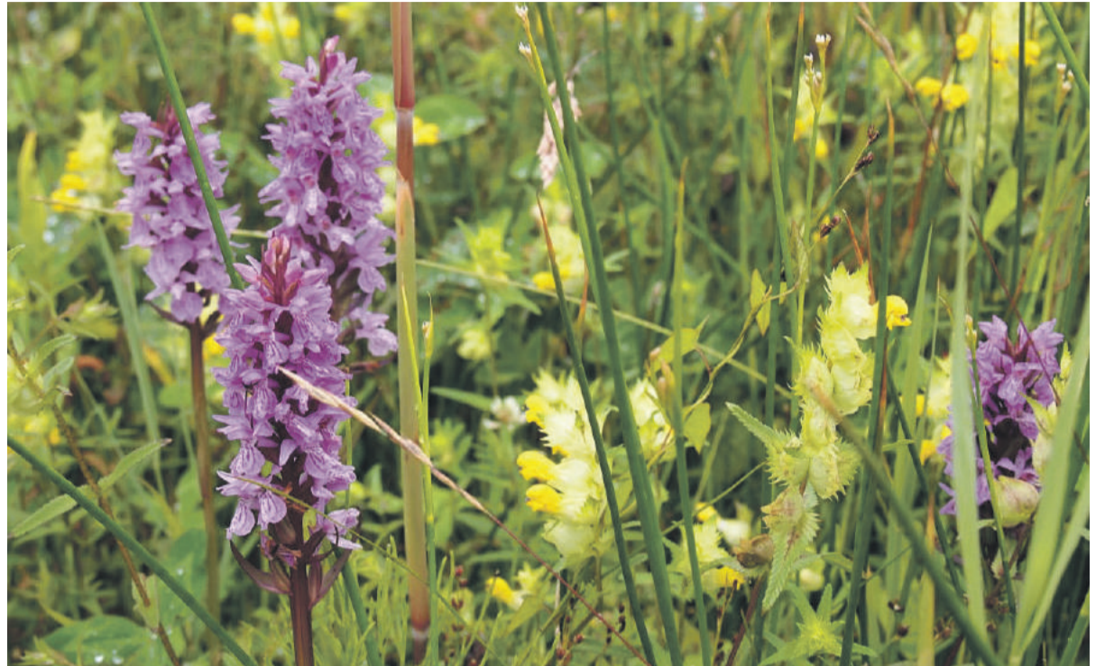
Rietorchis en grote ratelaar in het Rietland voor Buitendijke

Boomspiegels moeten ruim met rust worden gelaten en slootkanten mogen pas worden gemaaid als de watervogels zijn uitgebroed.