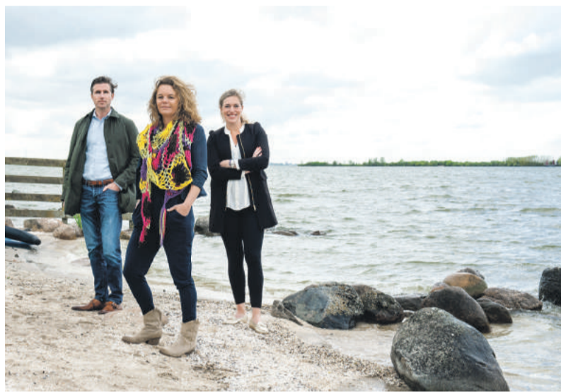
Gooise Meren Marketing

Vanwege de onderlinge verschillen tussen de vier plaatsen is dat geen gemakkelijke opdracht. Ons dorp bijvoorbeeld heeft geen leegstaande winkelpanden zoals Bussum, geen historisch stadscentrum zoals Naarden of een verdubbeling van het aantal huishoudens zoals in Muiden. Kortom, hoe verenig je al die verschillende belangen in één verhaal?